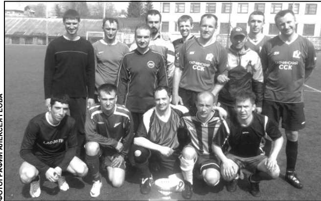
«ССК» – победитель Кубка открытия сезона, посвященного Дню Победы.