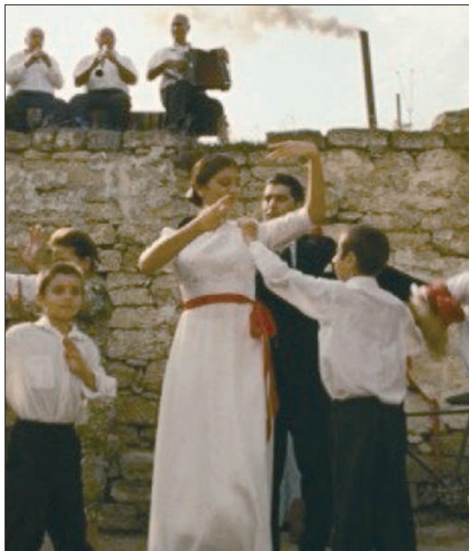
Кадр из фильма «И не было лучше брата».

Надо сказать, что этот фильм был снят в 2011 году в содружестве кинематографистов Азербайджана, России и Болгарии. Так после крушения Советского Союза и Социалистического содружества частично восстанавливается общее «культурное пространство». Ощущение, что попадаешь в наше прошлое на десятилетия назад. Собственно действие фильма происходит в Баку «советского периода», названного «застоем». Это в каких головах, простите, застой? И чего? «Ах, как хочется ворваться...» — это песенка про такие города — городки. «Где всё просто и знакомо...» Где соседи знают друг друга, где общаются в небольших двориках, а старики «стучат в домино».