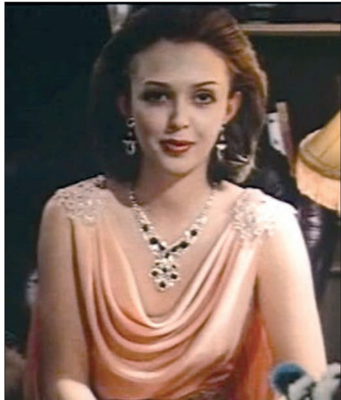
Кадр из фильма «Семь криков в океане».