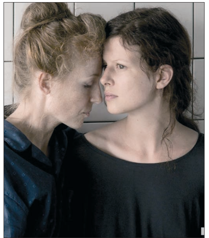
Кадр из фильма «Танец Дели».

И почему-то вспомнилась фраза из фильма «В тумане»: «Если жить хочешь, то как же идти на подлость?»