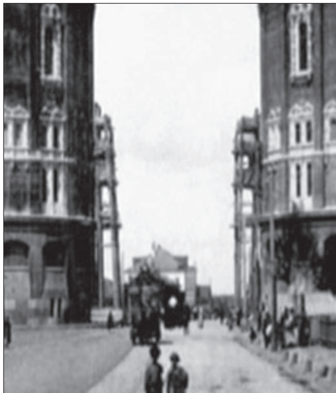
Кадр из фильма «Юргис Балтрушайтис: последний рыцарь «серебряного века».

После помоев, вылитых на Пушкина, освежающим душем стал документальный фильм режиссёра Е. Цымбала, снятого на «Студии 217» в 2012 году, в содружестве кинематографистов России и Латвии о поэте Юргисе Балтрушайтисе. Для меня это было открытие. В прошлые годы мы немного знали о тех, кто связал свою творческую биографию с опальными поэтами и деятелями искусства. Юргис Балтрушайтис жил в России в переломную эпоху. Он был другом Скрыбина и Чехова, Шаляпина и Толстого.