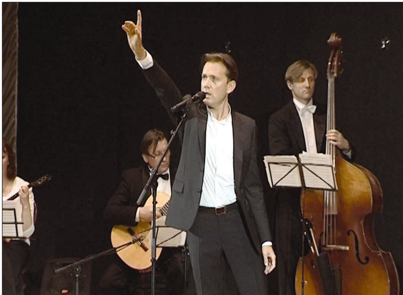
Материал читайте на 3-й стр.